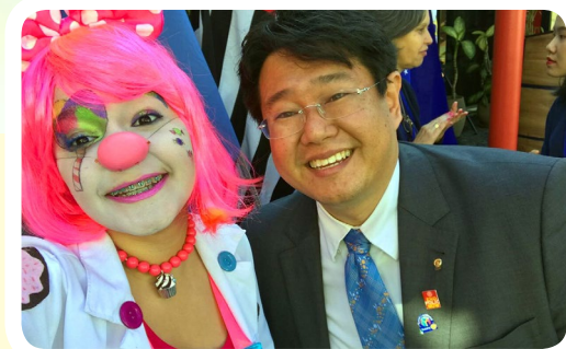
Rotary Distrito 4420 #EuApoioMcDiaFeliz