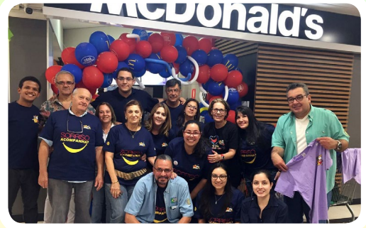
RC de São Paulo-Independência #AjudeUmAdolescenteComCâncer

Compartilhe suas ações e se conecte com a maior campanha nacional em prol de crianças e adolescentes com câncer. Junte-se a nós em 2018!