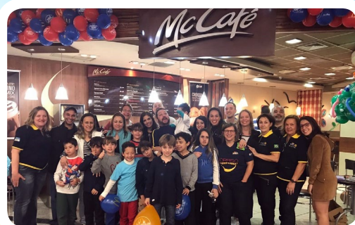
RC de Santo André-8 de Abril