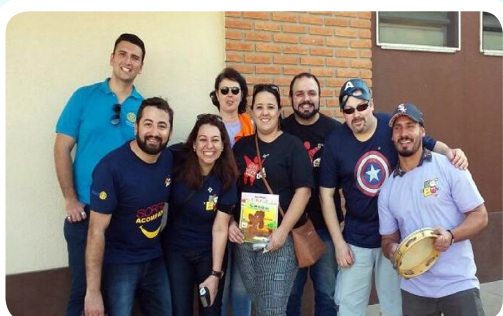
RC de Mauá-8 de Dezembro