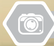
Ao lado do prefeito de Santos, o Governador Takata inaugurou as instalações