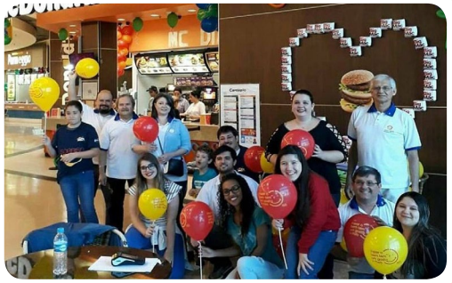
RC de Diadema-Floreat #AjudeUmaCriançaComCâncer