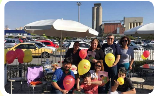
RC de São Caetano do Sul #AjudeUmaCriançaComCâncer