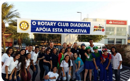
RC de Diadema