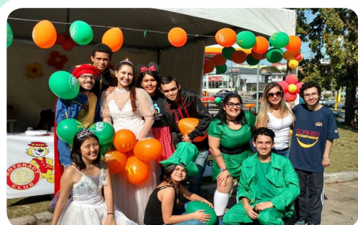
Rotaract Club de Mauá #AproximandoFamílias