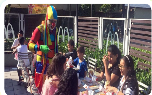
RC de Santos-Praia #TransformeBigMacEmSorrisos