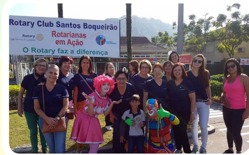
RC de Santos-Boqueirão #McDiaFeliz