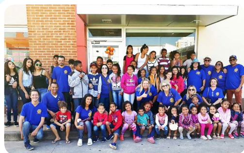
RC de Itanhaém