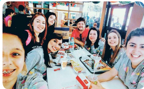
Rotaract Club Monteiro Lobato #AproximandoFamílias