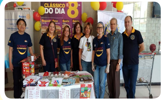
RC de São Bernardo do Campo-Norte #CadaBigMacConta