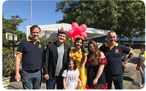
Interact Club de São Bernardo do Campo #TransformeBigMacEmSorrisos

Em todas as áreas do Rotary Distrito 4420, rotarianos, rotaractianos, interactianos e kidianos se mobilizaram em diversas ações de apoio à campanha McDia Feliz. Agradecemos a todos que dedicaram seu valioso trabalho nesta grande festa da solidariedade nacional. Juntos somos mais fortes e fizemos a diferença nas vidas dos portadores do câncer infanto-juvenil em todo o Brasil. Confira algumas fotos dos grupos de voluntários que ajudaram no sucesso da iniciativa realizada em 26 de agosto de 2017. Parabéns!