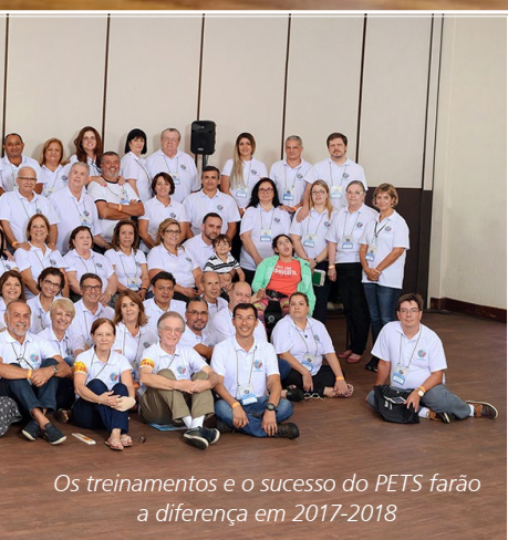
Os treinamentos e o sucesso do PETS farão a diferença em 2017-2018