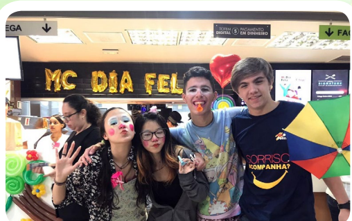
Interact Club de São Paulo-Aeroporto #PeçaBigMacEAjude