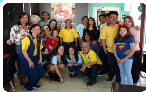
RC de Peruibe