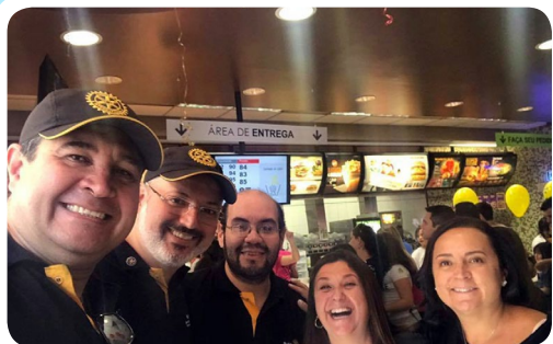
RC de São Paulo-Ponte Estaiada #PelaCuraDoCâncerInfantojuvenil