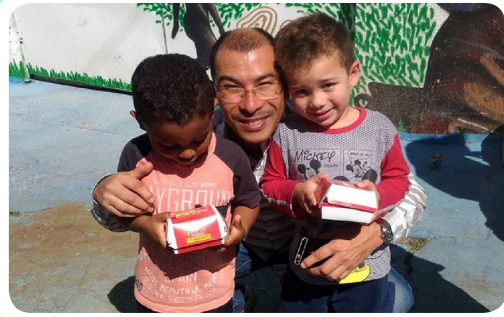
Rotary E-Club 4420 #EuApoioMcDiaFeliz