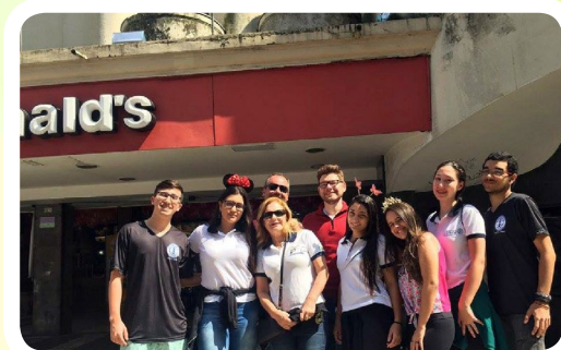
RC de Santos-Porto #CadaBigMacConta