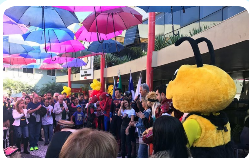
RC de Santo André