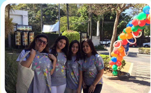
Interact Club Monteiro Lobato #CadaBigMacConta