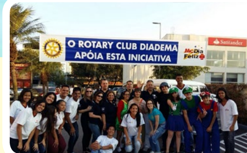
RC de Diadema #AjudeUmADolescenteComCâncer