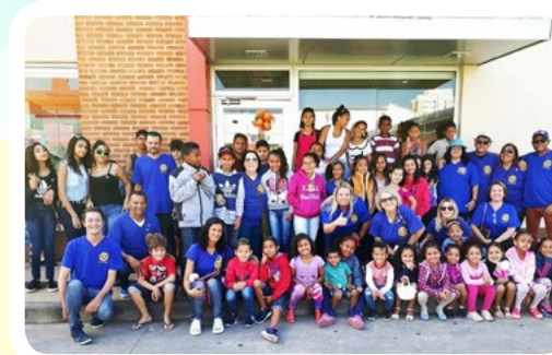
RC de Itanhaém #PelaCuraDoCâncerInfantojuvenil