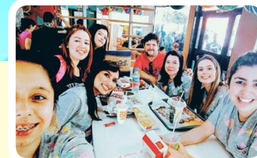
Rotaract Club Monteiro Lobato #AproximandoFamílias