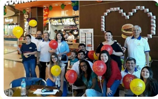
RC de Diadema-Floreat #AjudeUmaCriançaComCâncer