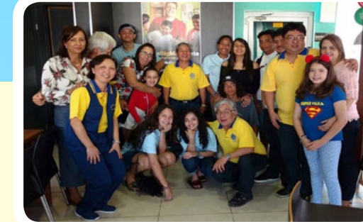
RC de Peruíbe #AproximandoFamílias