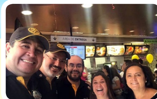
RC de São Paulo-Ponte Estaiada #PelaCuraDoCâncerInfantojuvenil