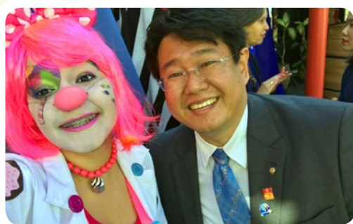
Rotary Distrito 4420 #EuApoioMcDiaFeliz