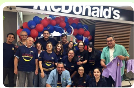
RC de São Paulo-Independência #AjudeUmADolescenteComCâncer