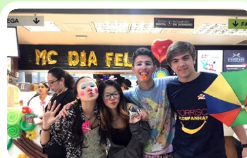
Interact Club de São Paulo-Aeroporto #PeçaBigMacEAjude