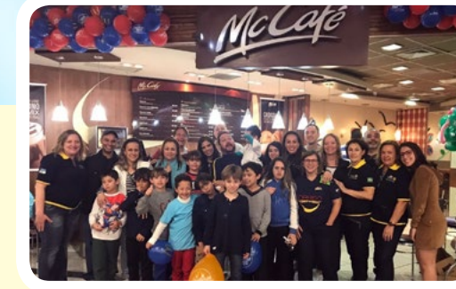
RC de Santo André-8 de Abril #EuApoioMcDiaFeliz