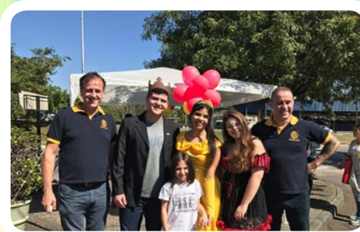
Interact Club de São Bernardo do Campo #TransformeBigMacEmSorrisos

Em todas as áreas do Rotary Distrito 4420, rotarianos, rotaractianos, interactianos e kidianos se mobilizaram em diversas ações de apoio à campanha McDia Feliz. Agradecemos a todos que dedicaram seu valioso trabalho nesta grande festa da solidariedade nacional. Juntos somos mais fortes e fizemos a diferença nas vidas dos portadores do câncer infanto-juvenil em todo o Brasil. Confira algumas fotos dos grupos de voluntários que ajudaram no sucesso da iniciativa realizada em 26 de agosto de 2017. Parabéns!