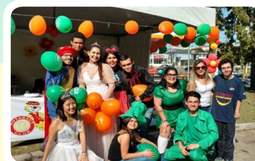
Rotaract Club de Mauá #AproximandoFamílias