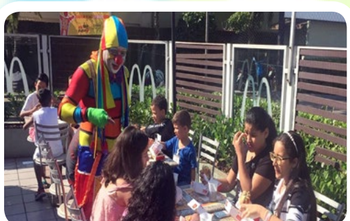
RC de Santos-Praia #TransformeBigMacEmSorrisos