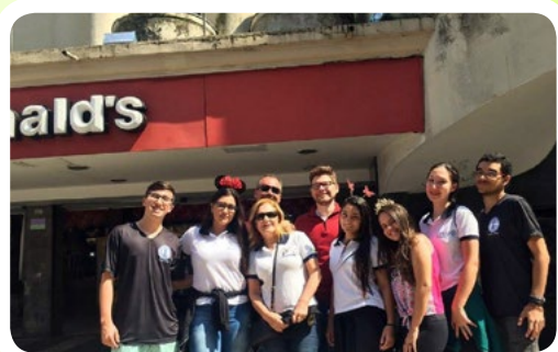
RC de Santos-Porto #CadaBigMacConta