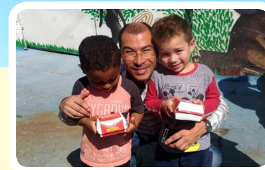
Rotary E-Club 4420 #EuApoioMcDiaFeliz