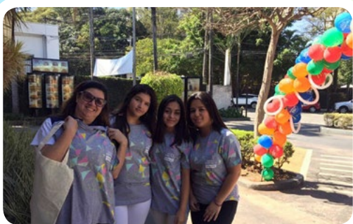
Interact Club Monteiro Lobato #CadaBigMacConta