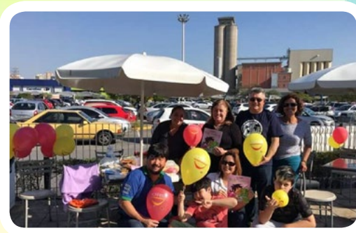
RC de São Caetano do Sul #AjudeUmaCriançaComCâncer