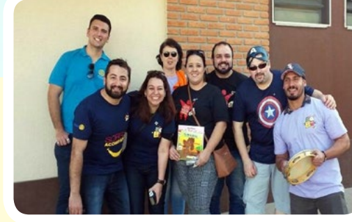
RC de Mauá-8 de Dezembro #BigMac=MuitosSorrisos