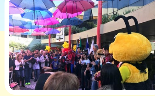
RC de Santo André #InstitutoRonaldMcDonald