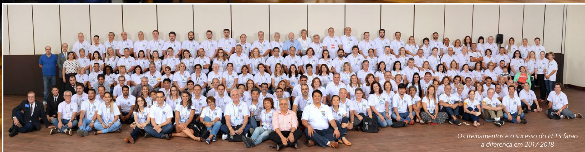
Os treinamentos e o sucesso do PETS farão a diferença em 2017-2018