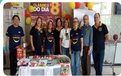
RC de São Bernardo do Campo-Norte #CadaBigMacConta