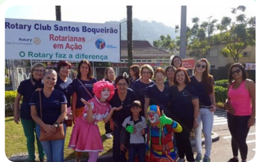
RC de Santos-Boqueirão #McDiaFeliz