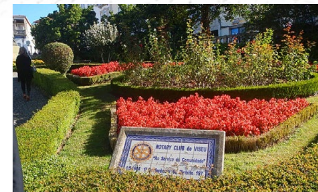
Marco rotário em Viseu foi visitado pelos brasileiros