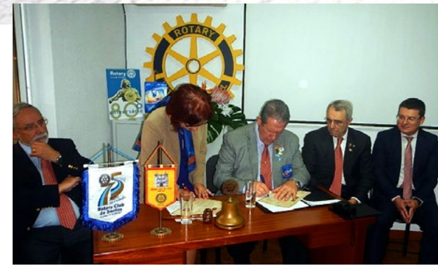
Presidente do RC de Santos formaliza geminação em Viseu