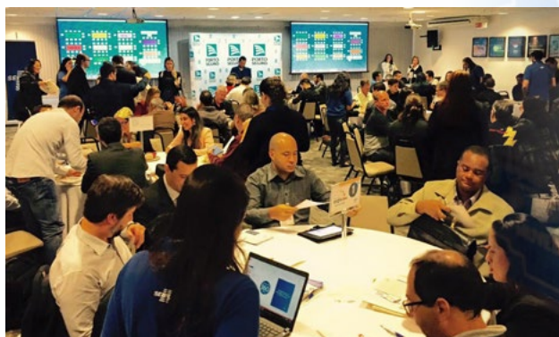
Sessão de negócios é uma das ações que o Sebrae realiza