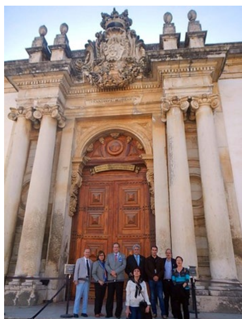
Visita à Universidade de Coimbra