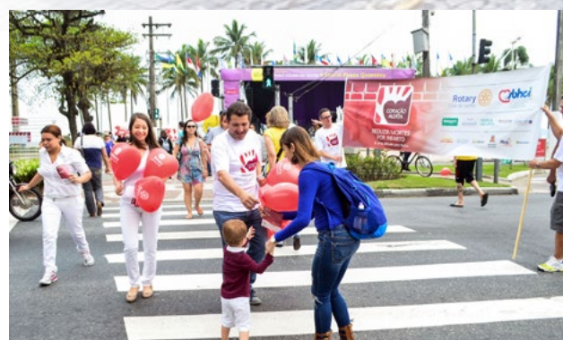
Projeto Coração Alerta será aplicado no clube português