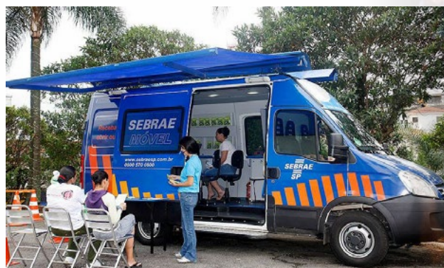
O Sebrae Móvel leva informações em situações pontuais