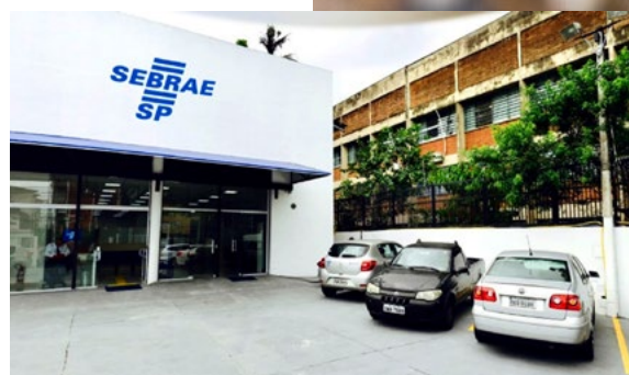
O ERBS do Sebra-SP fica no Canal 3, em Santos/SP

Realizada enquanto fechávamos esta edição da Revista Rotary 4420, a 6ª Feira do Empreendedor do Sebrae-SP é considerada o maior evento do empreendedorismo brasileiro em 2017. Organizada de 18 a 21 de fevereiro, no Pavilhão de Exposições do Anhembi, na cidade de São Paulo/SP, ela reuniu expositores, consultores empresariais e milhares de pessoas que buscavam as melhores formas para empreender. “Neste ano, a feira teve um formato de Cidade Empreendedora, simulando situações reais do dia-a-dia empresarial. Diversos rotarianos marcaram presença no evento, aproveitando uma ótima oportunidade para se atualizarem neste infinito mundo dos negócios”, finaliza o gerente.