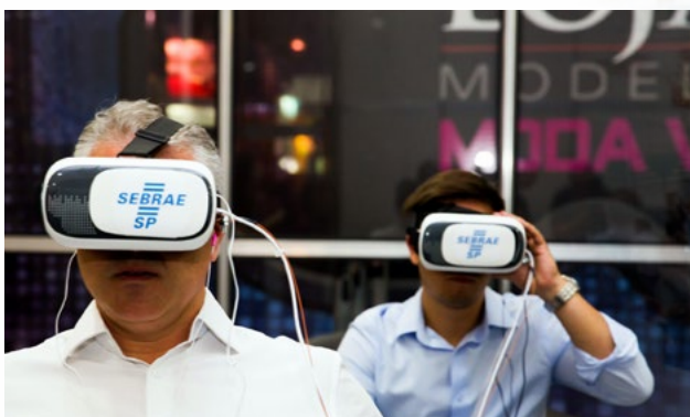
A tecnologia é importante aliada dos novos empreendedores