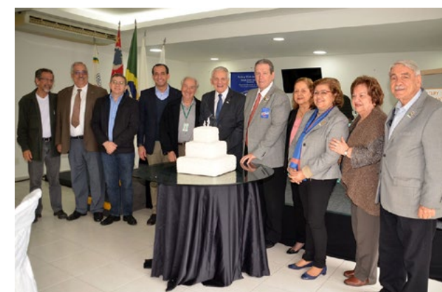
Em 2016, a entidade fez 59 anos de serviços prestados