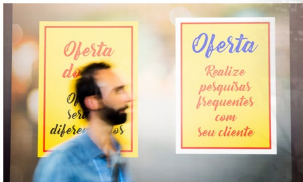
Análise de mercado é fundamental no negócio