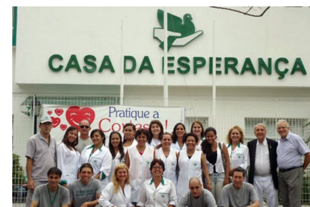
Colaboradores e direção são unidos pelo mesmo ideal