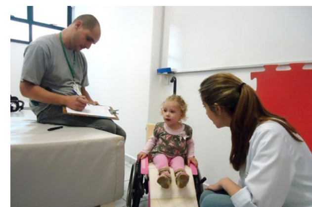
A Casa atende cerca de 280 crianças da Baixada Santista