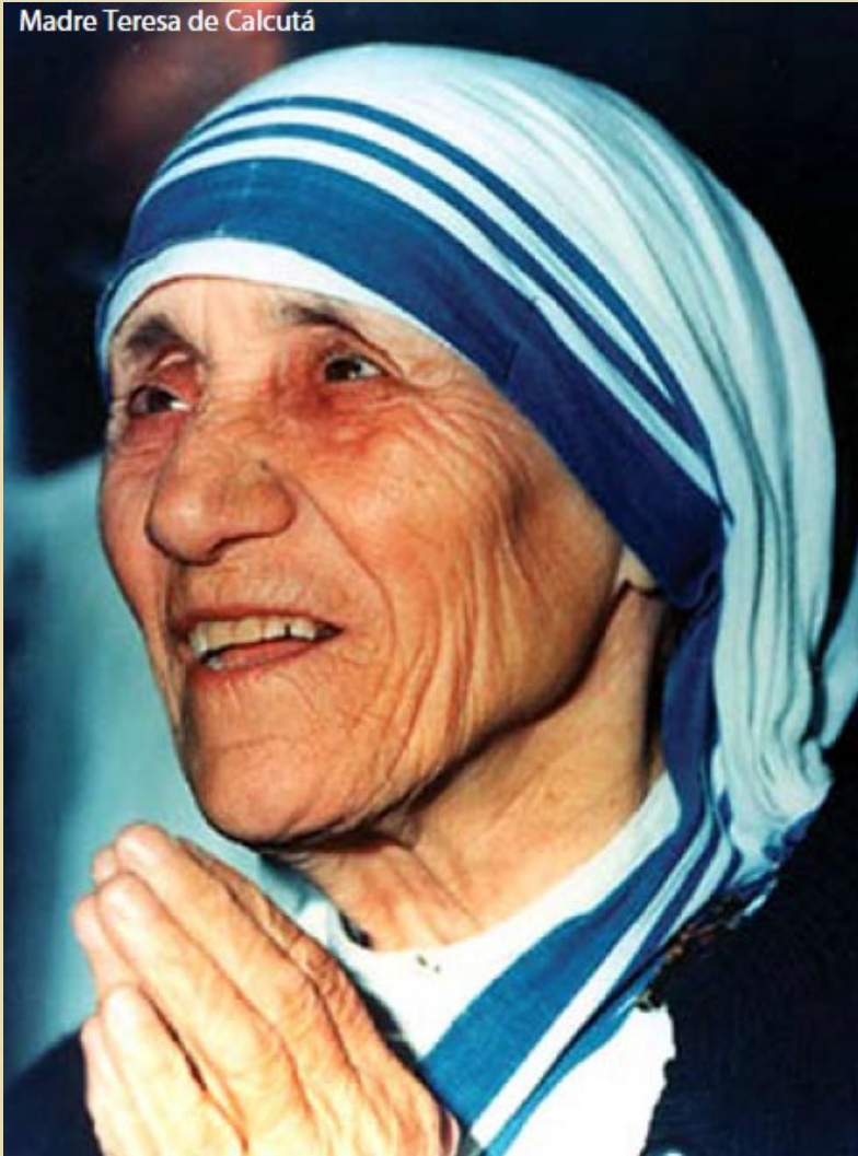
Madre Teresa de Calcutá