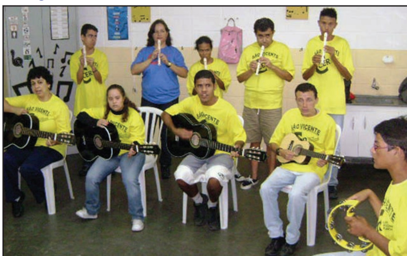
Além dos clubes casal governador visita entidades

DQS: padrinhos concorrem à cabine da Conferência